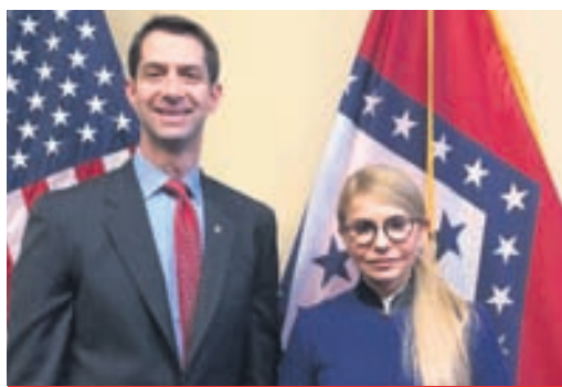
Том Коттон и Юлия Тимошенко

Будапештский меморандум был заключен 24 года назад — 5 декабря 1994 года. Его официальное название — Меморандум о гарантиях безопасности в связи с присоединением Украины к Договору о нераспространении ядерного оружия.