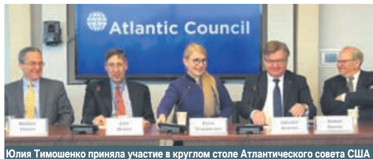
Юлия Тимошенко приняла участие в круглом столе Атлантического совета США

В рамках визита в Штаты глава партии «Батьківщина» встретила с сенатором от штата Иллинойс, высокопоставленным членом Демократической партии США и членом сенатского комитета по обороне Ричардом Дурбином. Стороны обсудили ситуацию в сфере безопасности в Украине, а также коснулись некоторых вопросов украинской экономики и политики. Юлия