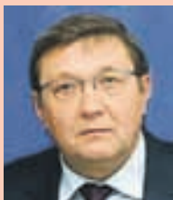
Віктор СУСЛОВ , заслужений економіст України, екс-міністр економіки:

«Конституційним обов'язком Національного банку України є підтримання стабільності гривні. Але регулятор намагається нас переконати в тому, що стаття 99 Основного закону передбачає лише стримування зростання цін, тобто боротьбу з інфляцією, і що діяльність НБУ жодним чином не поширюється на визначення курсу нацвалюти. Це некоректно з економічної точки зору, адже стабільність валютного курсу — найважливіший елемент збереження стабільності гривні.