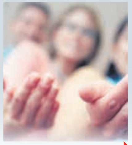
ЗАТРИМКА ЗАРПЛАТИ ПОЗБАВЛЯЄ ПРАВА НА ГІДНЕ ЖИТТЯ