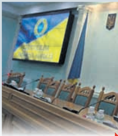
ЦЕНТРАЛЬНА ВИБОРЧА УЗУРПАЦІЯ