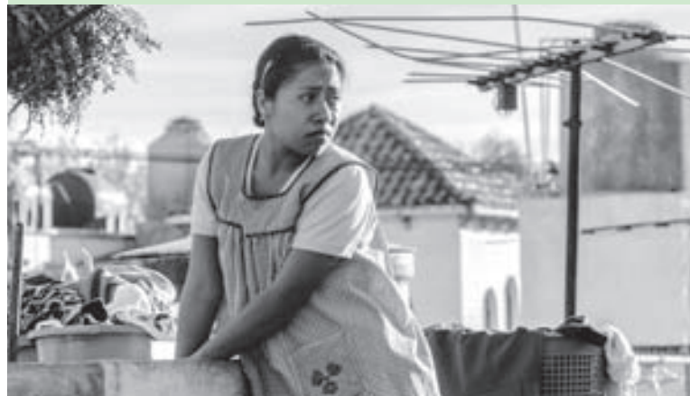
Сторінку підготувала Євгенія ПРОРИВАЙ

Насправді нам намагання прищепити думку, що це виняткова стрічка, в якій прихований таємний зміст. Що це фільм для обраних і нам треба відключити свій мозок й просто аплодувати його творцю. Та «Рома» — це просто фальшивка, яка і нігтя не варта жодного фільму — лауреата «Оскара» та навіть багатьох номінантів. Творець «Гаррі Поттера і в'язня Азкабана» й «Гравітації» дуже хотів виділитися, але спроба виявилася невдалою. Вже через рік-два про «Рому» не згадає ніхто.