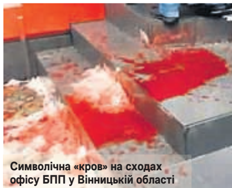
Символічна «кров» на сходах офісу БПП у Вінницькій області

Сергій ГОДУН, Вікторія МИКИТЮК, газета «33-й канал» (№12, 14 березня 2018 року)