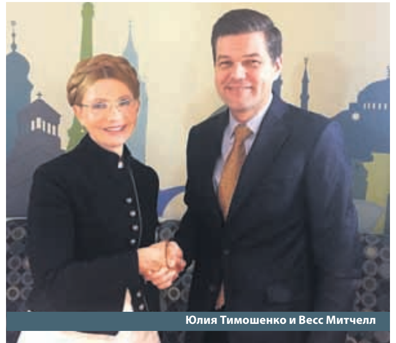
Юлия Тимошенко и Весс Митчелл

Во время своего визита Юлия Тимошенко приняла участие в Национальном молитвенном завтраке, на котором присутствовал президент США Дональд Трамп.