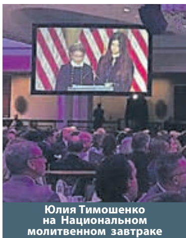
Юлия Тимошенко на Национальном молитвенном завтраке