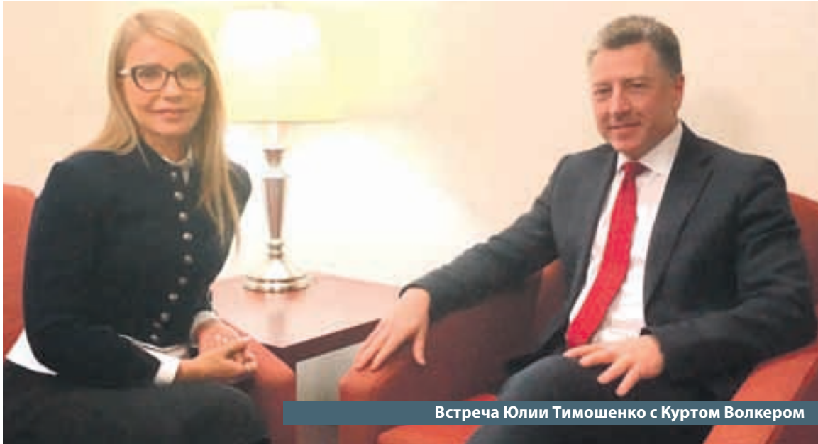
Встреча Юлии Тимошенко с Куртом Волкером

Делегация «Батьківщини», в состав которой вошли Юлия Тимошенко, Григорий Немыря и Сергей Власенко, на прошлой неделе посетила Соединенные Штаты Америки с рабочим визитом. В Вашингтоне политики провели ряд важных встреч.