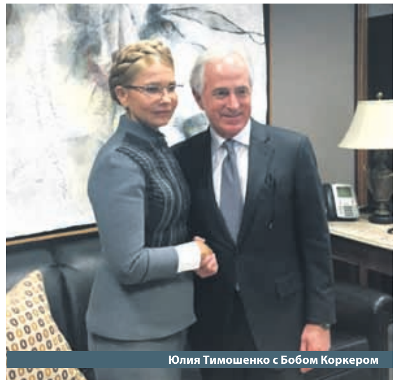
Юлия Тимошенко с Бобом Коркером