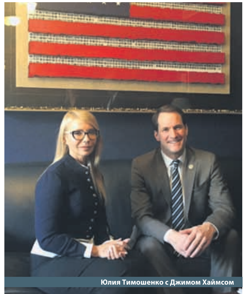
Юлия Тимошенко с Джимом Хаймсом