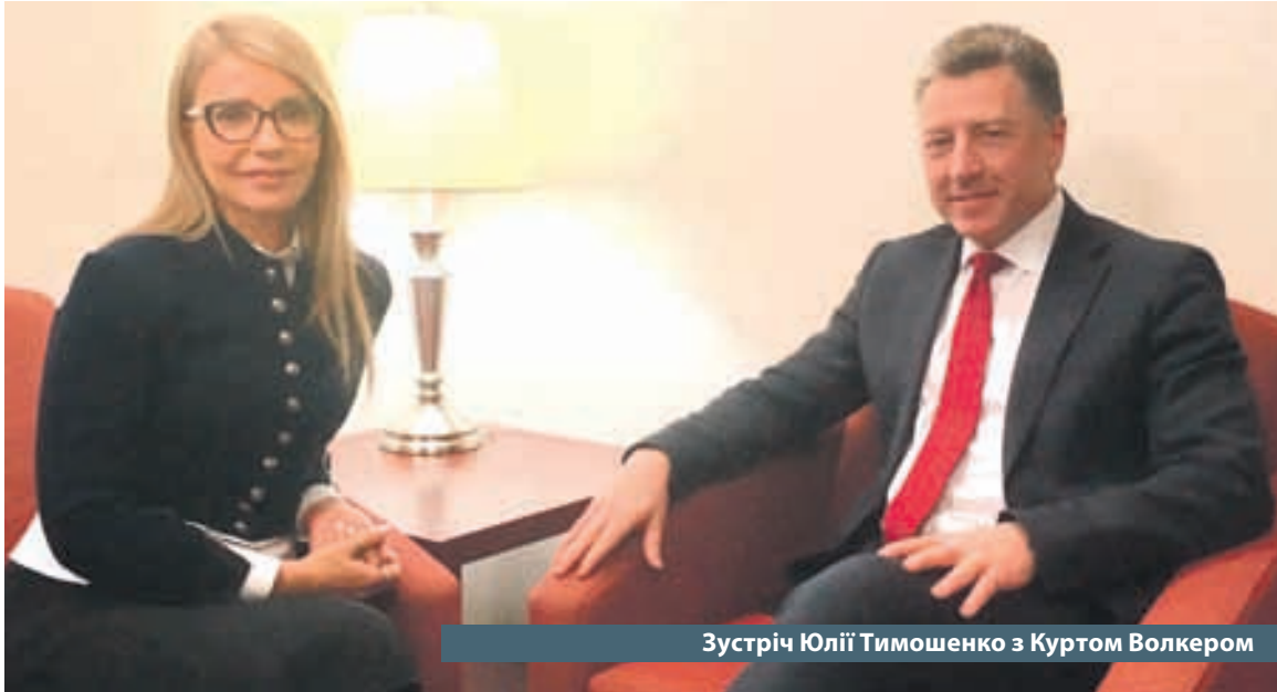
Зустріч Юлії Тимошенко з Куртом Волкером

Делегація «Батьківщини», до складу якої увійшли Юлія Тимошенко, Григорій Немиря та Сергій Власенко, минулого тижня відвідала Сполучені Штати Америки з робочим візитом. У Вашингтоні політики мали низку важливих зустрічей.