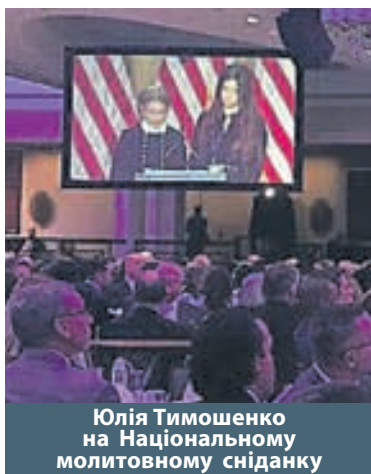
Юлія Тимошенко на Національному молитовному сніданку

Політик мала бесіду з помічником державного секретаря США у справах Європи та Євразії Вессом Мітчеллом. Вони обговорили ймовірні шляхи досягнення миру на сході України та питання навколо анексованого Росією Криму.