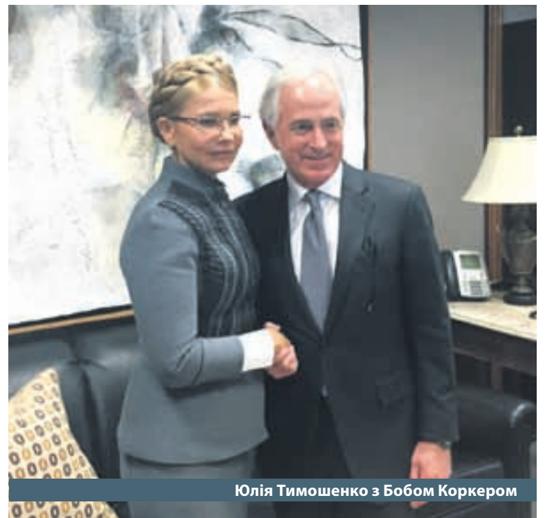
Юлія Тимошенко з Бобом Коркером