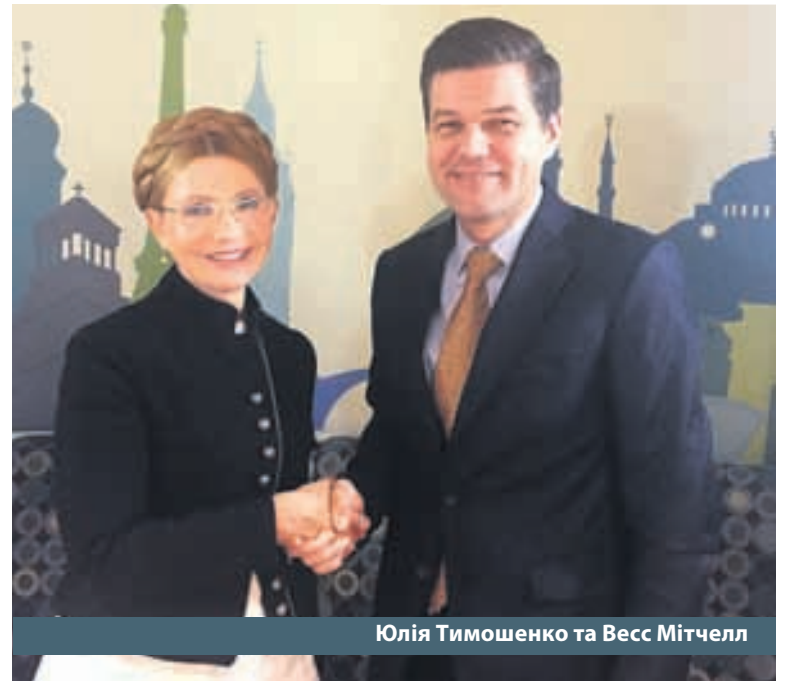
Юлія Тимошенко та Весс Мітчелл

Під час свого візиту Юлія Тимошенко також взяла участь у Національному молитовному сніданку, на якому був присутній президент США Дональд Трамп.