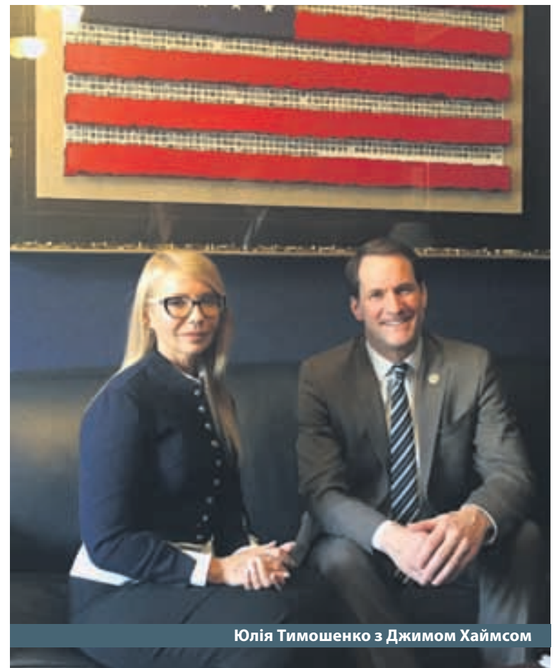
Юлія Тимошенко з Джимом Хаймсом